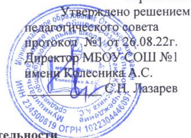
Таблица – сетка часов внеурочной деятельности для 1-х классов, реализующих обновлённый федеральный государственный образовательный стандарт начального общего образования МБОУ СОШ №1 имени Колесника А.С. станции Отрядной Отрядненского района Краснодарского края на 2022-2023 учебный год