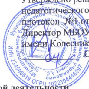
Таблица – сетка часов внеурочной деятельности для 4-х классов, реализующих федеральный государственный образовательный стандарт начального общего образования МБОУ СОШ №1 Колесника А.С. станции Отрядной Отрядненского района Краснодарского края на 2022-2023 учебный год